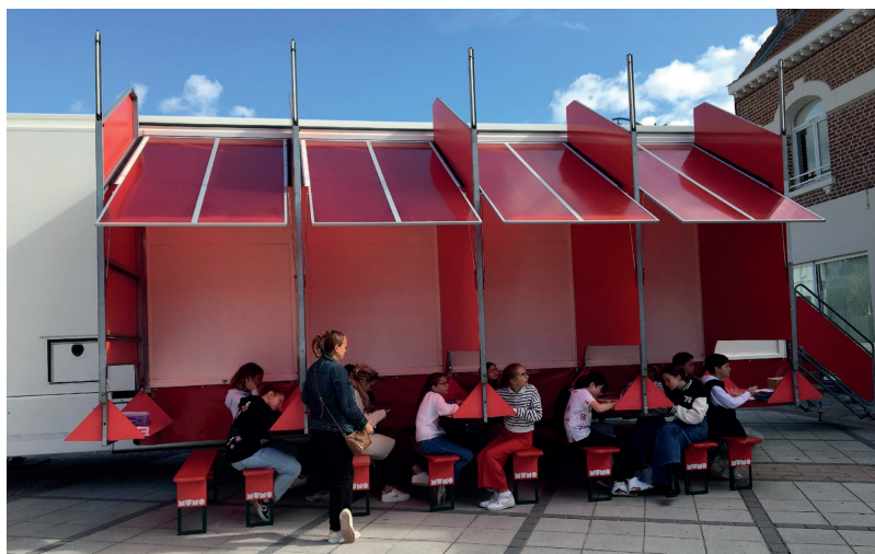
Le MuMo à Vitry-en-Artois. Résonance Triennale Art & Industrie.

« Une très belle collaboration avec le FRAC, autant dans le choix commun des pièces mises à disposition, que dans les liens avec les équipes, que dans la rencontre avec les artistes présents durant le festival. » (Espace Croisé - Roubaix)