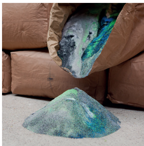
Maximum, Chaise Gravêne , 2019