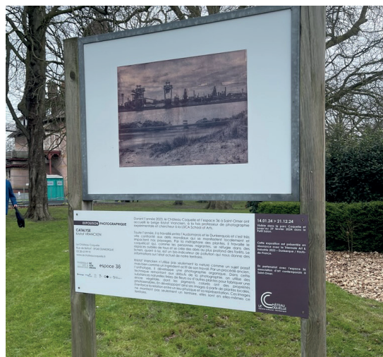
Kristof Vranken. Le Château Coquelle, Dunkerque. Résonance Triennale Art & Industrie.