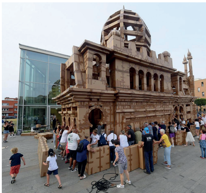
Tout en carton

Au Bateau Feu, construction d'un monument gigantesque : un bâtiment utopique et éphémère, fait de cartons d'emballage et de ruban adhésif. Cette expérience collective et festive a été dirigée par l'artiste plasticien Olivier Grossetête et son équipe, qui proposent des constructions monumentales participatives en cartons dans le monde entier.