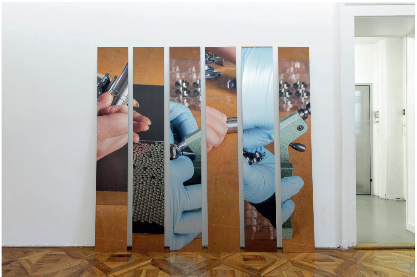
Aurélie Pétrel, Décolletage_Apimontage_Cluses # 1-60 , 2016