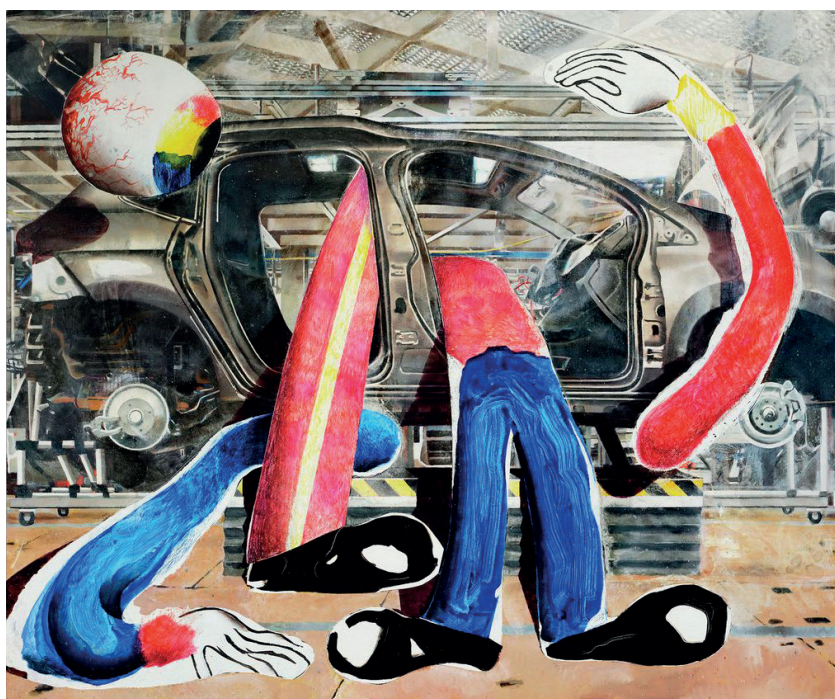
Laurent Proux, Les opérateurs , 2018

Des matériaux aux infrastructures, le cœur de la manifestation sera consacré à l'exploration de façons justes et vertueuses de réinventer l'industrie, dans des logiques prometteuses de réemploi ou de réhabilitation, génératrices de nouvelles formes, de nouveaux imaginaires et d'usages autres. L'exposition rassemblera des œuvres et des projets d'artistes, de designers (objet, textile, mode, services), d'artisans et d'architectes, ainsi que des documents et des archives. Assumant une dimension à la fois muséale et exploratoire, elle présentera, aux côtés d'œuvres achevées, des processus et des projets de recherche en cours, avec le souci de s'adresser au plus grand nombre et d'articuler le passé, le présent et le futur.