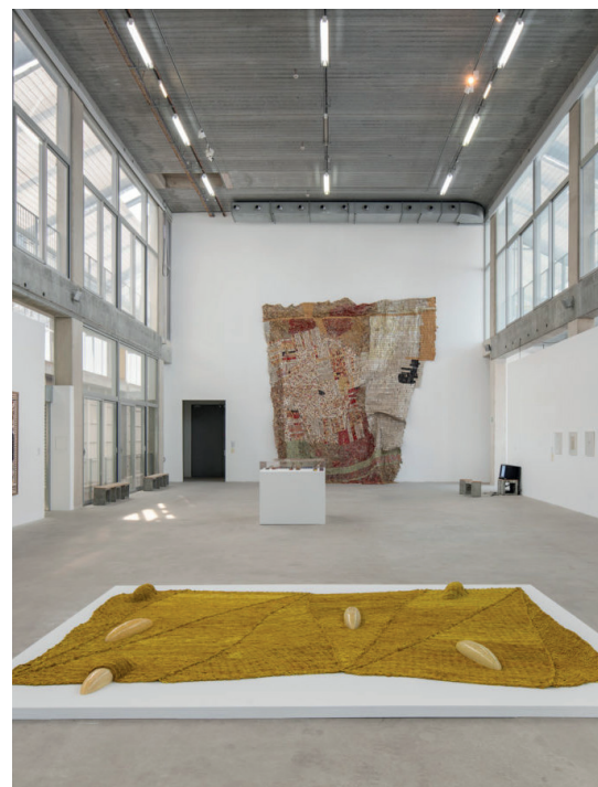
Vue d'exposition au Frac Grand Large, Chaleur humaine , Triennale Art & Industrie, 2023.