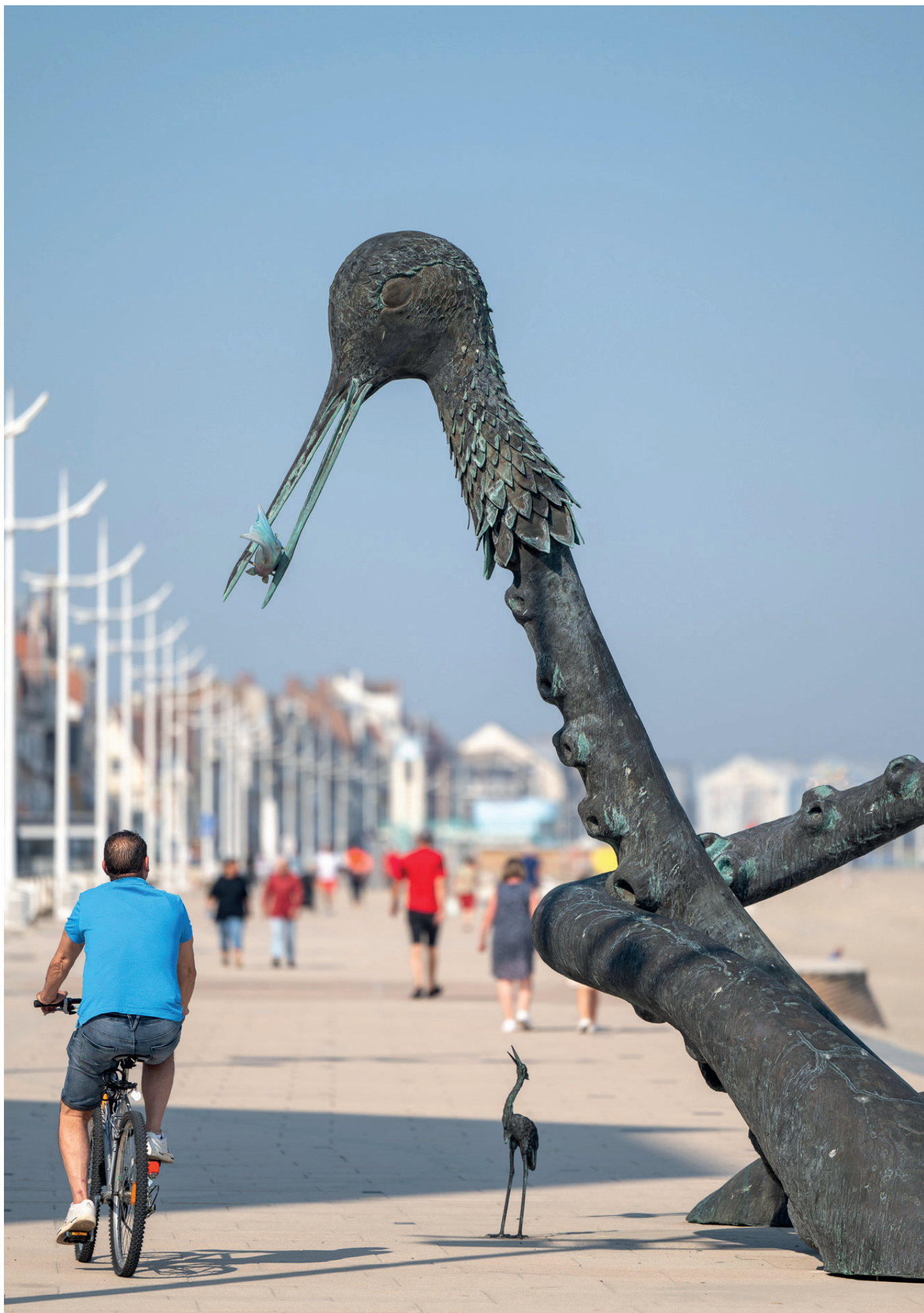
Laure Prouvost, Oui Will Become One Another , 2023. Commande publique de la Communauté Urbaine de Dunkerque.