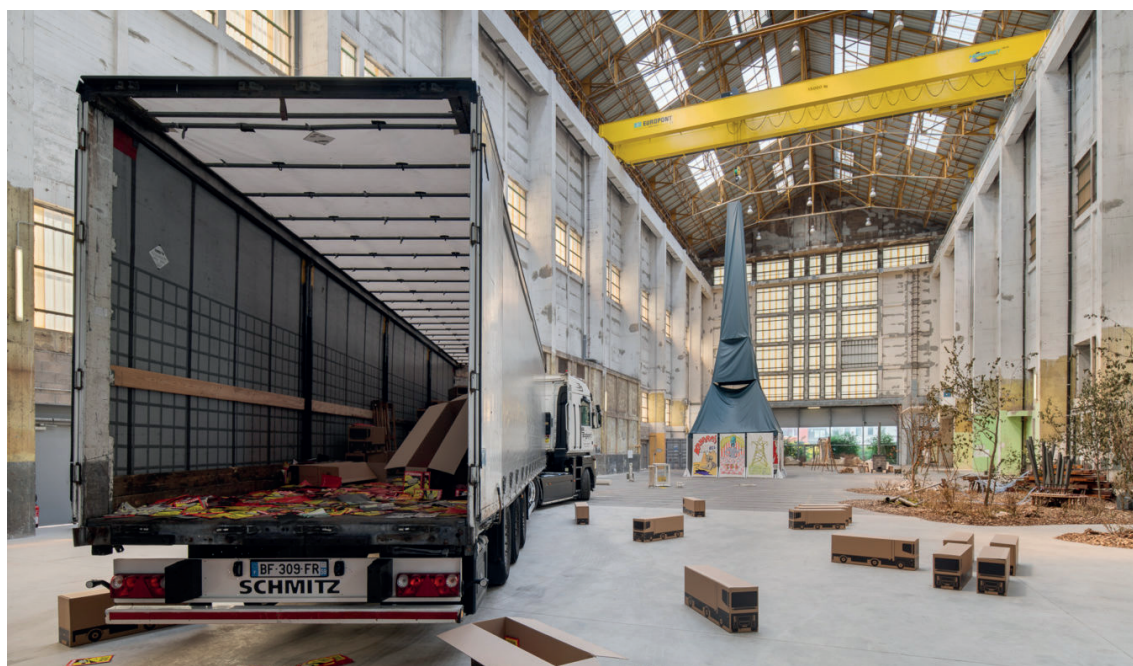
Vue de la Halle AP2, Chaleur humaine , Triennale Art & Industrie, 2023.

La 3 ème édition, actuellement en préparation par le Frac Grand Large, marquera un nouveau chapitre de collaborations entre les établissements culturels, le monde économique et les territoires des Hauts-de-France.