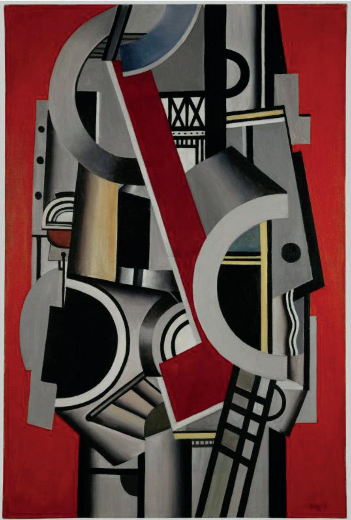
Fernand Léger, Élément mécanique , 1924