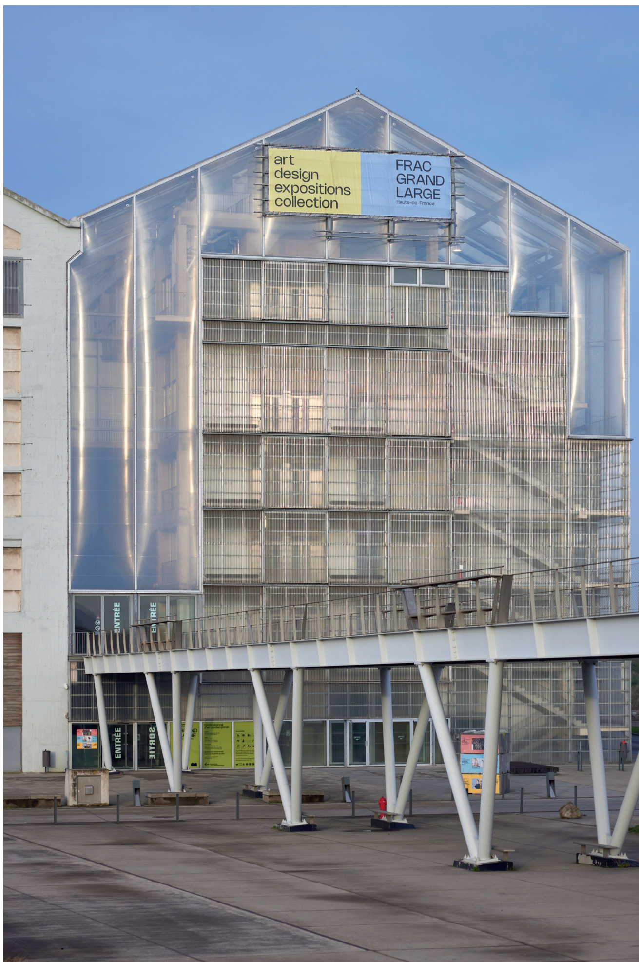
Vue du bâtiment du Frac Grand Large