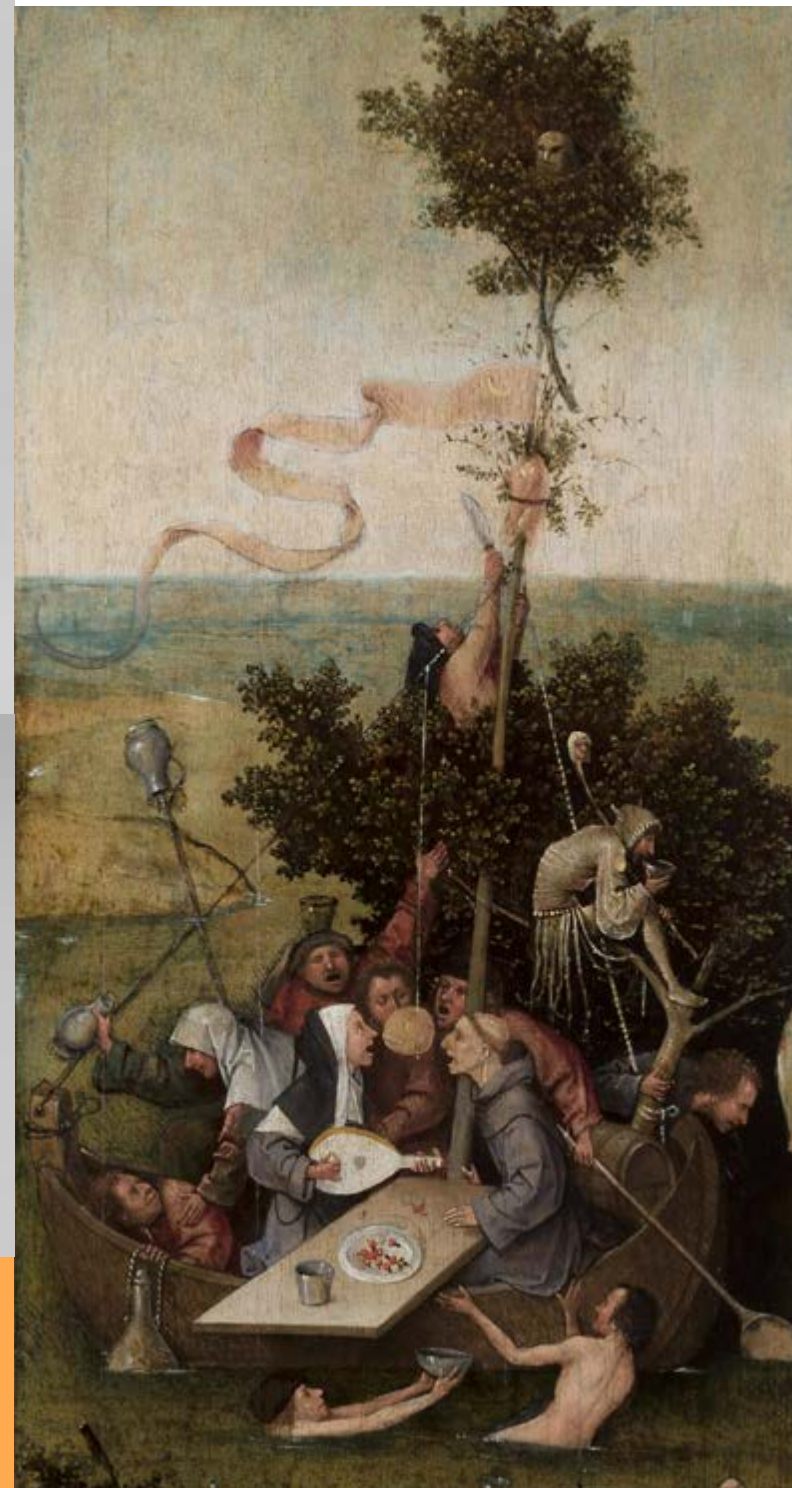
Jérôme Bosch, Het narrenschip , circa 1500, olieverf op paneel, 58,1 x 32,8 cm, Paris, musée du Louvre