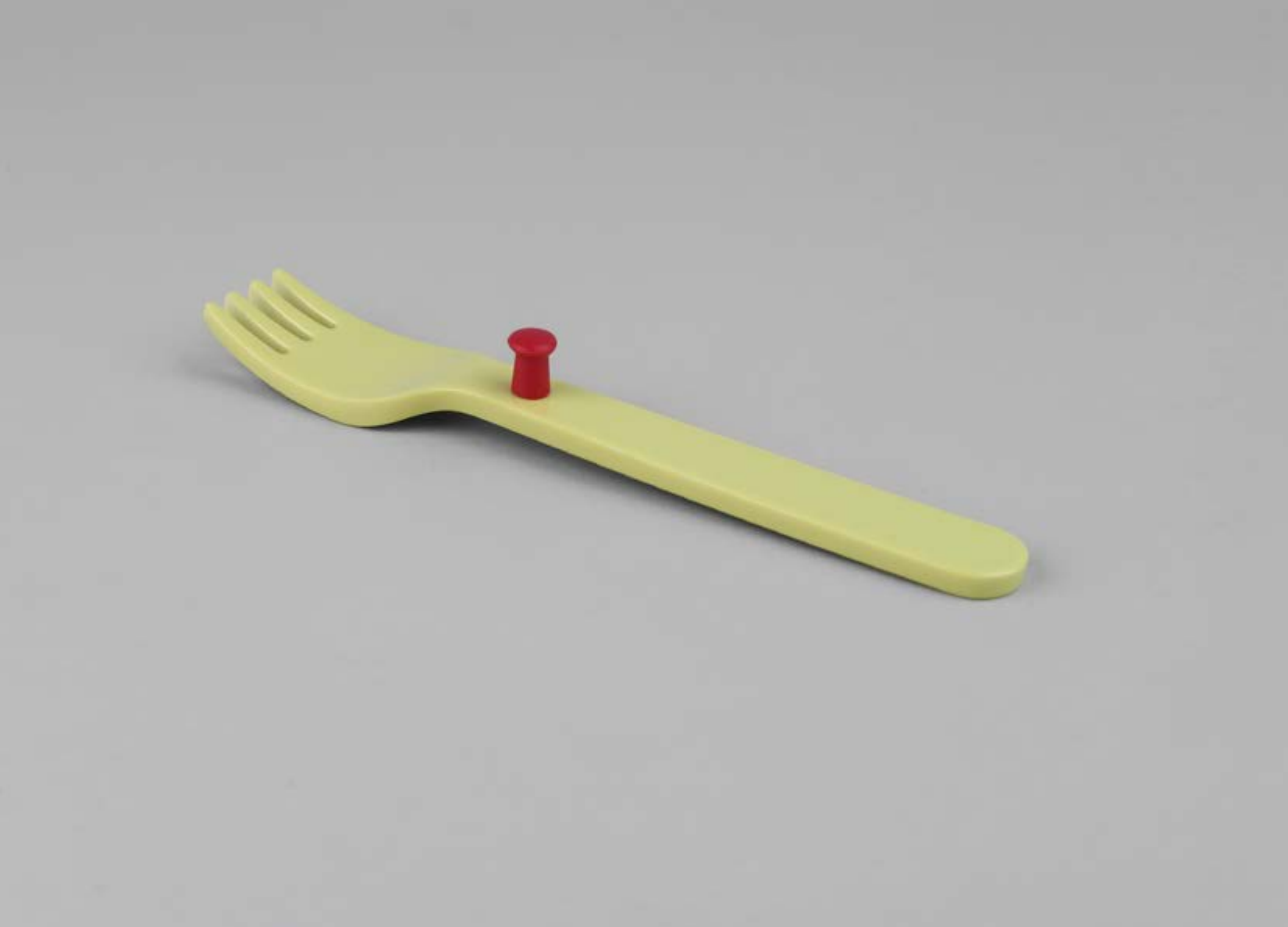
Wendy Boudewijns, Royal VKB, Puzzle Dinner Tray