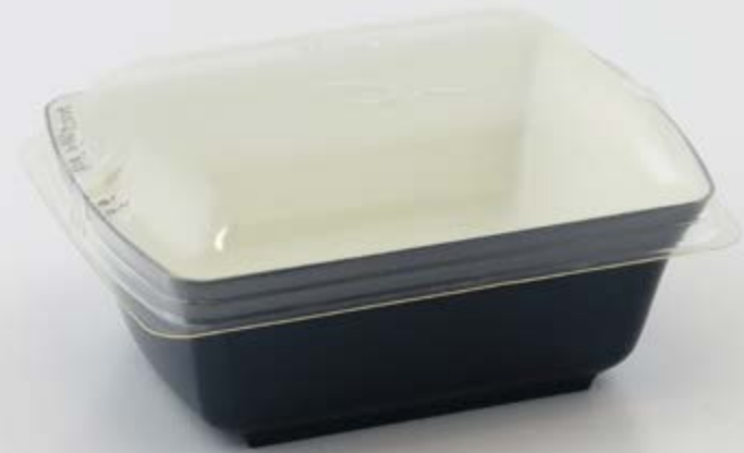
deSter, schaal van kunststof