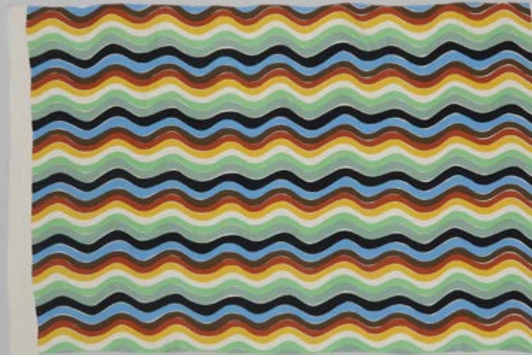
Philippe Starck, Hoesch Design, Badkuip van kunststof en inox ontworpen door Philippe Starck en geproduceerd door Hoesch Design Sonia Delaunay, Rythmes

In 2012 presenteerde Design Museum Gent de succesvolle tentoonstelling Destrøy/Design , waarin een groot aantal werken uit de unieke collectie van Frac Grand Large – Hauts-de-France werden samengebracht. Design en beeldende kunst stonden toen al naast elkaar opgesteld, op gelijk niveau en in dialoog. Vandaag, 10 jaar later, is Het narrenschip . Objecten van vervoer(ing) , het bijzondere resultaat van een nieuwe samenwerking tussen de twee instituten. Deze keer met een omvangrijke hoeveelheid verrassende designobjecten uit onze collectie, die in relatie worden geplaatst met hedendaagse kunstwerken uit de collectie van het Frac. Onze tijdelijke sluiting, in functie van de museumuitbreiding DING (Design In Gent), biedt trouwens het ideale moment om met de collectie naar andere locaties te ‘reizen’. Frac Grand Large is de eerste halte.