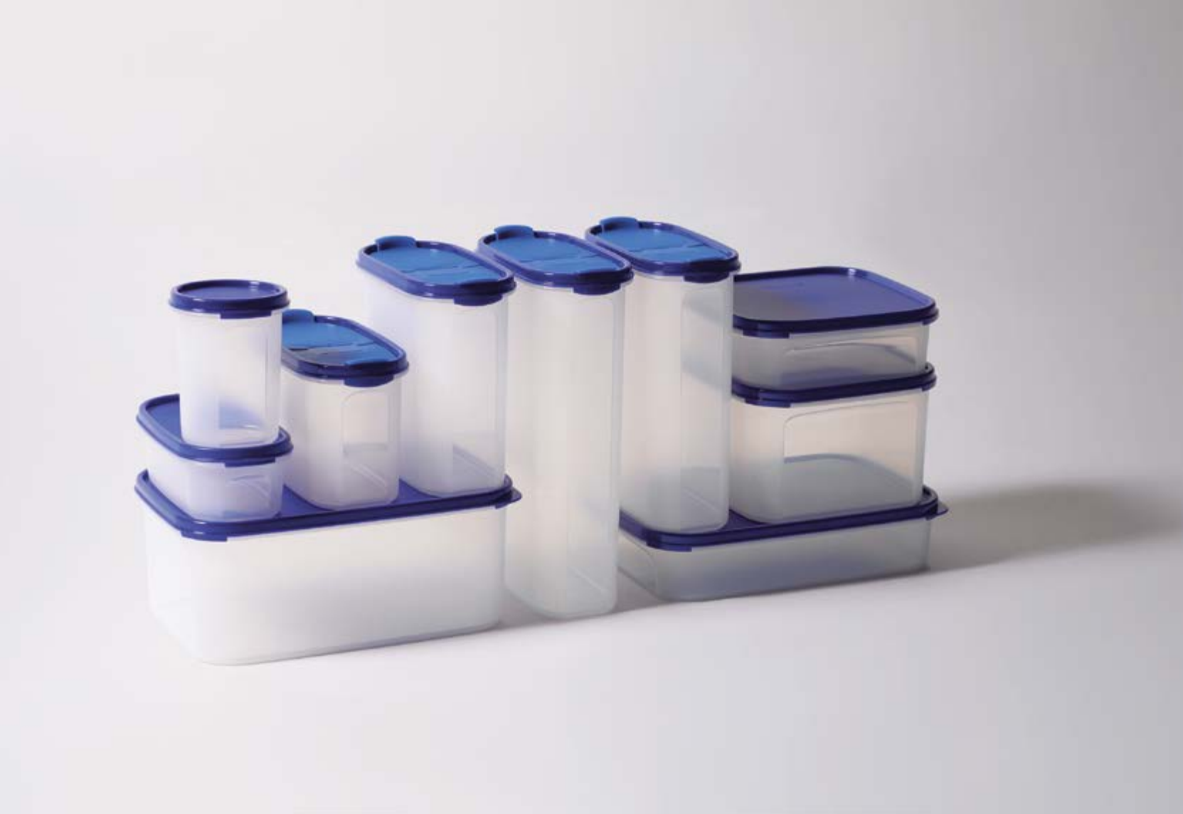
Bob Daenen, Pieter de Coster, Tupperware, Super Eidgenossen/Space Savers Super Ovals