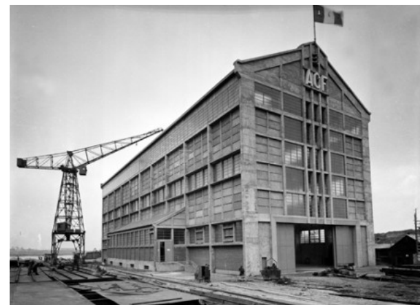
Vue de l'AP2 à l'époque des Chantiers de France. dimensions : 75 mètres de long, 25 mètres de large, 25 à 30 mètres de haut.

Anne Lacaton (1955 -) et Jean-Philippe Vassal (1954 -), agence Lacaton & Vassal créée en 1987, Frac Nord - Pas de Calais, 2009-2013, élévation de la façade des deux bâtiments mitoyens, Dunkerque, France.