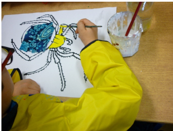
Productions d'élèves de l'école La Campagne de Bourbourg.