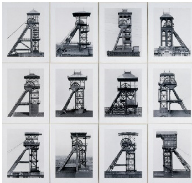
Bernd (1931 - 2007) et Hilla (1934 - 2015) Becher, 12 Winding Towers, 1971-1979, 12 photographies noir et blanc encadrées sous un même support, dimensions du cadre : 125 x 155 cm, collection Frac Grand Large — Hauts-de-France, Dunkerque, France.

Sous l'objectif de Bernd et Hilla Becher, des équipements fonctionnels deviennent de véritables sculptures dégagant une forme inédite de beauté. Le couple de photographes a sans doute été parmi les premiers artistes à poser un nouveau regard sur les édifices liés au monde du travail pour en révéler les qualités plastiques.