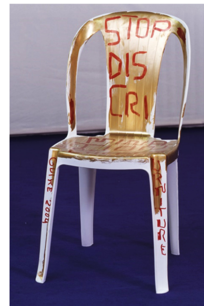
Martí Guixé (1964-), Statement Chair : Stop Discrimination of Cheap Furniture! , 2004, installation réalisée par le designer pour son exposition Skip Furniture , Spazio Lima, à l'occasion du Salon du Meuble de Milan 2004, installation de 10 chaises graffitées, signées et numérotées, plastique injecté, peinture acrylique, installation de dimensions variables, Frac Grand Large — Hauts-de-France, Dunkerque, France.

Comme son titre l'indique, cette œuvre est à percevoir comme un manifeste invitant le spectateur à changer de regard sur les objets usuels et à chercher une autre forme de beauté dans le quotidien.