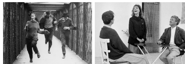
François Truffaut (1932-1984), Jules et Jim , film français en noir et blanc, 1962, adapté du roman du même nom de Henri-Pierre Roché paru aux éditions Gallimard en 1953, 102 min.

Pourquoi faire référence au cinéma dans une pièce de design ? Pourquoi une artiste contemporaine s'intéresse-t-elle à une époque passée pour réinventer le présent ? Pourquoi chercher à faire revivre le passé ? Peut-on se reconnaître dans une autre époque ? Les objets peuvent-ils fonctionner comme des signaux ?