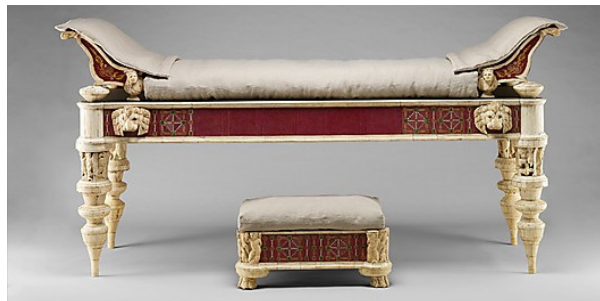
Lectus et tabouret incrusté de verre et d'os gravés, I er et II ème siècle ap.J.C., bois, os, verre, pièces de mobilier reconstituées à partir de fragments, certains provenant de la villa impériale de Lucius Verus, Rome, Metropolitan Museum of Art, New York, USA.