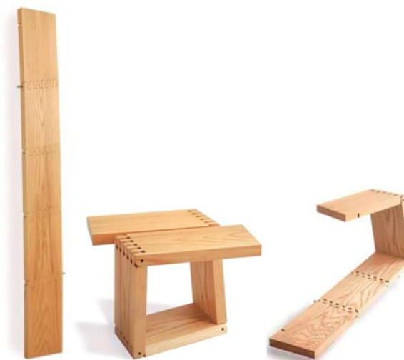
Thomas Heatherwick (1970-), Plank , 2000, meuble à fonction variable (tabouret, table d'appoint, etc.), frêne, finition huilée, 40 x 55 x 69 cm, dimension dépliée : 188 cm de long, collection FRAC Nord - Pas de Calais, Dunkerque, France.

Tous les objets doivent-ils avoir une fonction bien définie ? Quelle est la place de l'inutile dans la société moderne ? Les objets n'existent-ils que pour la fonction pour laquelle ils ont été conçus ? Comment l'homme arrive-t-il à trouver sa part de liberté dans une société où ses choix sont orientés ?